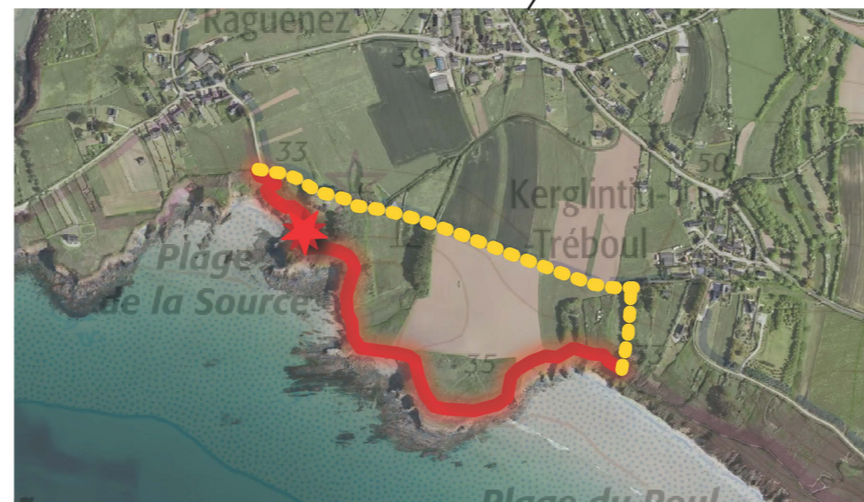
Secteur La Source