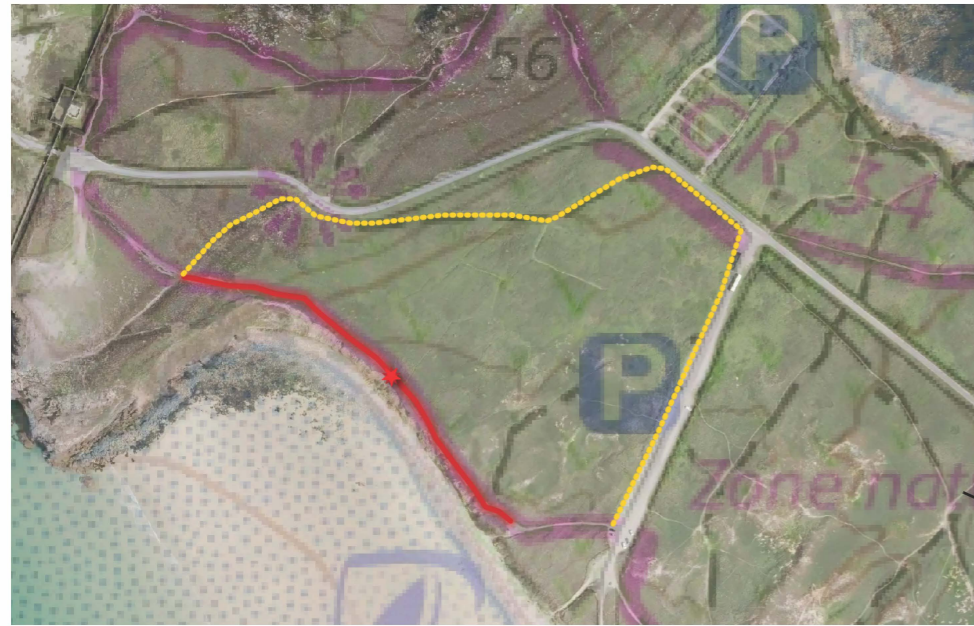
Secteur Pen Hat