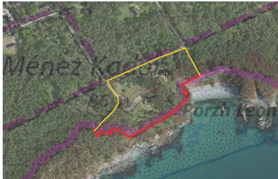
Secteur Porzh Leon