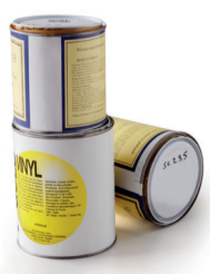
Déchets ménagers spéciaux