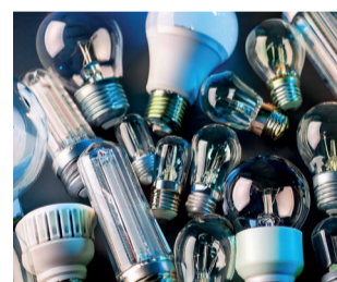
Lampes et néons