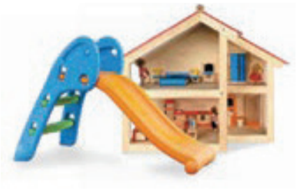
Articles de sport et de loisirs