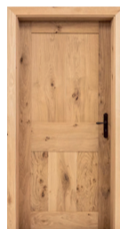
Bois (tout bois et aggloméré)