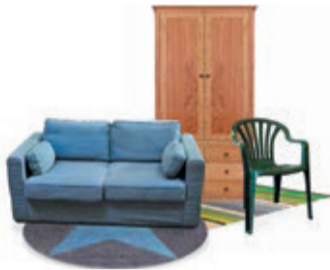
Mobilier intérieur et extérieur