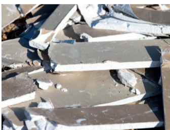
Encombrants (Laine de roche, laine de verre, fenêtre en bois...)