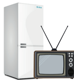
Équipement électrique et électronique