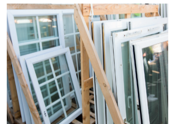
Huisseries PVC et alu