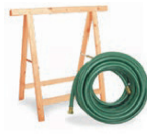
Bricolage et jardin