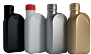
Huile de vidange