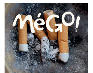
Mégots de cigarettes