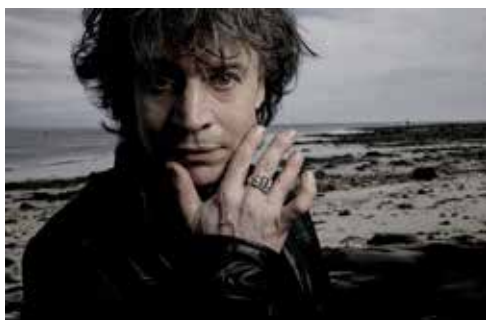
Denez Prigent