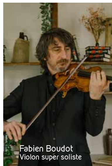
Fabien Boudot Violon super soliste

L'Orchestre National de Bretagne est financé par le Région Bretagne, le Ministère de la Culture - DRAC Bretagne, la Ville de Rennes, le Conseil Départemental d'Ille-et-Vilaine, avec le soutien du Conseil Départemental du Morbihan et de Rennes Métropole.