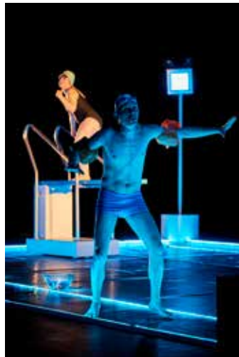
Allez, Ollie... à l'eau !