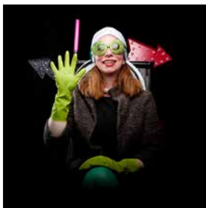
Le cri de la plante verte