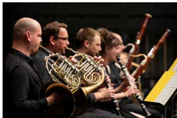
Ensemble Avel Breizh