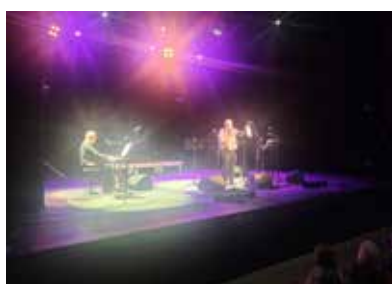
Les Tréteaux chantants