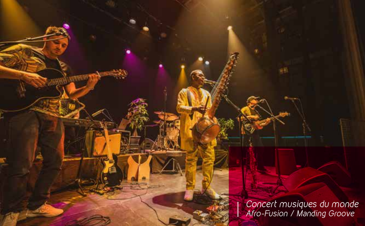
Concert musiques du monde Afro-Fusion / Manding Groove