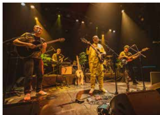
Petit Adama © Pierre Baelen