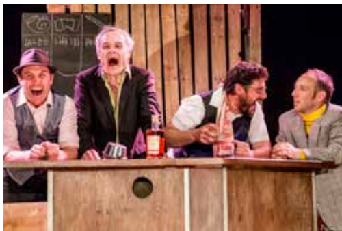
Hic ! © Pierre Noirault