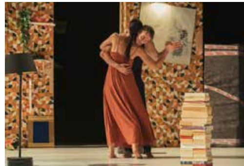
Valse avec W.