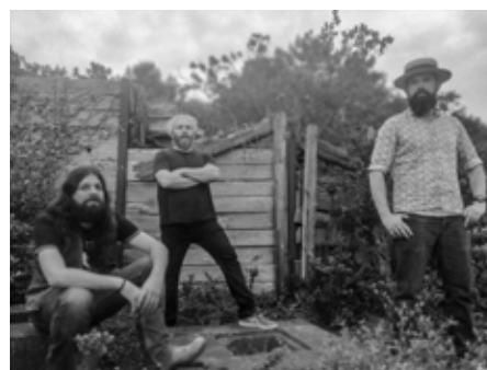
Wakan © Aurélien Gillet