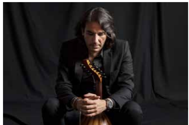
Samir Aouad © Germain Herriau