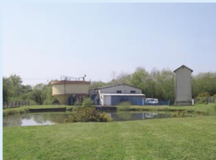
Usine de production d'eau de Poraon.