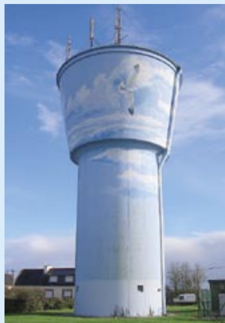
Réservoir de Camaret.