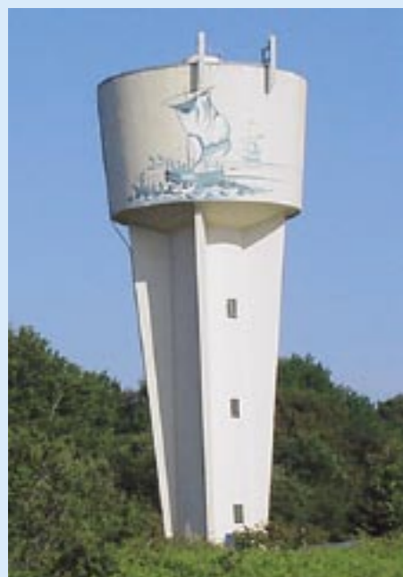
Réservoir de Lanvéoc.